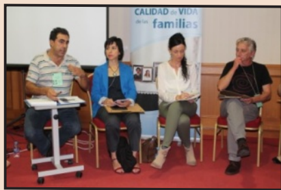
Hermanos y Cuñados

Segovia nos acogió con los brazos abiertos. Fue un fin de semana lleno de muchas alegrías, optimismo y una gran ilusión.