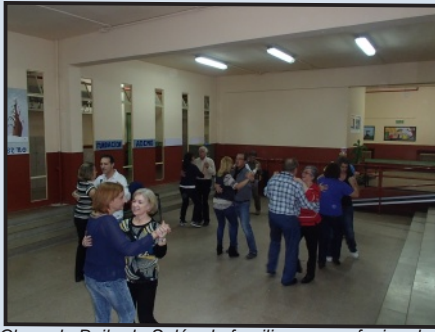
Clase de Baile de Salón de familiares y profesionales

de bailes: de salón, en el que aprendimos a bailar, entre otros, swing, rock and roll, pasodoble, bolero, tango ; y latinos como bachata, salsa, merengue, kizomba , etcétera. No me arrepentí de haber asistido. Puedo asegurar que con lo aprendido hemos podido bailar en un par de bodas, en la comida de Ademo y en la verbena del pueblo con dignidad y sin llamar demasiado la atención.