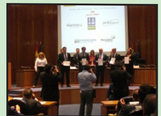
Acto de Entrega

El día 11 de noviembre la Fundación ADEMO recibió el diploma que nos acredita como empresa familiarmente responsable (efr) . El acto se celebró en el ministerio de Sanidad, Servicios Sociales e Igualdad , y fue presidido por la ministra Ana Mato . En el mismo se hizo entrega de los diplomas “ efr ” a todas las empresas y entidades que lograron su certificación en esta materia durante el año 2013. Entre las 65 organizaciones premiadas se encontraban, además de Fundación ADEMO , diferentes colegios como los Sauces y Brains , el ayuntamiento de Sevilla , Gas Natural Fenosa , o Liberty seguros .