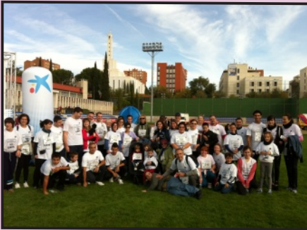
Foto de Grupo de los corredores de F. Ademo

Más de 200 personas participaron en la 1ª Carrera Solidaria de Moratalaz organizada el día 10 de Noviembre por la Fundación ADEMO , la Fundación ALAS Moratalaz y la Asociación Atlética de Moratalaz , la cual cedió la estructura de su tradicional media maratón para poder realizar este evento solidario.