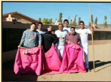
Usuarios de F. Ademo en la capea