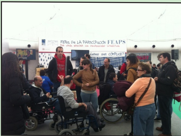
Usuarios, Familiares, Profesionales y Voluntarios de la Fundación Ademo.

Desde Fundación Ademo hemos querido sumarnos a esta celebración, para lo cual tuvimos que adherirnos y realizar un Plan de Actividades con las principales acciones relacionadas con la participación que desde la Fundación pensábamos realizar durante el año 2013. Destacamos entre muchas, la participación en la VIII Semana de la Solidaridad de Arganda del Rey , la organización de la I Semana por la Discapacidad y de la I Carrera Solidaria , estas dos últimas realizadas en Moratalaz y junto a la Fundación Alas .