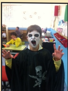
Usuario del CEE Ademo

El 31 de Octubre en nuestro cole fue un día muy especial, celebramos Halloween . Todo el colegio se disfrazó de monstruos, brujas, esqueletos, zombis, momias, demonios y fantasmas. Después en el comedor, con música aterradora, chuches y galletas, nos lo pasamos de la muerte jugando a asustarnos.