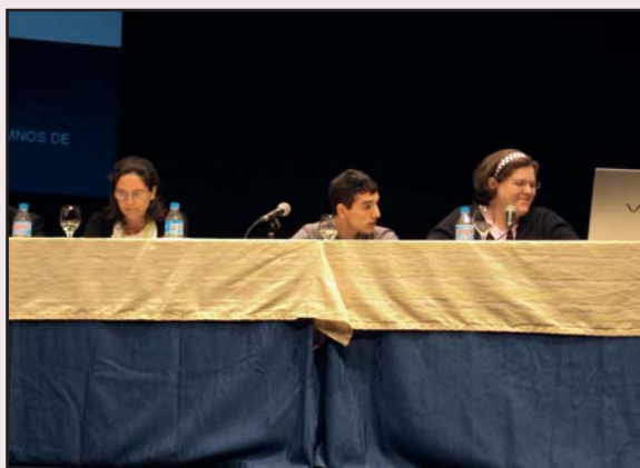
CONGRESO DE BUENAS PRÁCTICAS

escenario, en una mesa, con otra compañera del curso y estuvimos hablando de los tipos de cuestionarios que pasamos a las personas con discapacidad, de cómo había sido el curso, etc. El auditorio era muy grande y había muchas personas, la experiencia me pareció bien, pero al estar ahí y no estar acostumbrado a ver mucha gente delante de mí, estuve un poco nervioso. Lo bueno es que intenté tranquilizarme e intenté expresarme bien y al final me salió muy bien. La gente me felicitó. También era la primera vez que iba a Mallorca y la primera vez que subí en avión, y me gustó mucho.