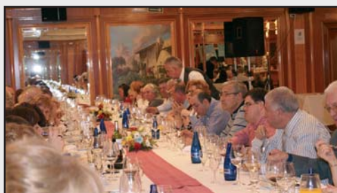
MOMENTO DE LA COMIDA

del próximo año, al que animo a todas las familias a participar.