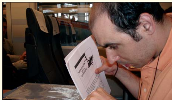
LUCHANDO POR NUESTROS DERECHOS