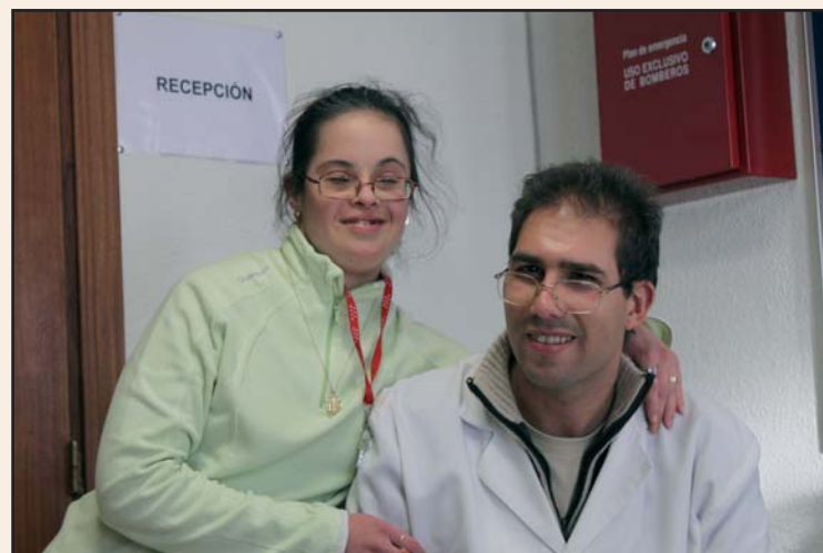
PROGRAMA DE RECEPCIÓN

"Que los compañeros que no son de recepción entren a molestar o se metan en nuestro trabajo"